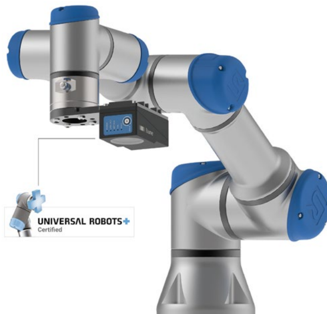
Bild 1: Die smarten VeriSens ® Vision Sensoren XF900 und XC900 steuern die kollaborierenden Roboter (Cobots) von Universal Robots schon nach wenigen Minuten Einrichtung.

Roboter orientieren sich an eingelernten, festen Wegpunkten und fahren diese nacheinander ab. Bildverarbeitung erweitert diese Funktionalität enorm. Ein einfach mitgeführter Vision Sensor versetzt den Roboter bereits in die Lage, Objekte sicher zu identifizieren. Gleichzeitig oder alternativ ist auch eine Qualitätskontrolle realisierbar, die der Roboter durch Verfahren des