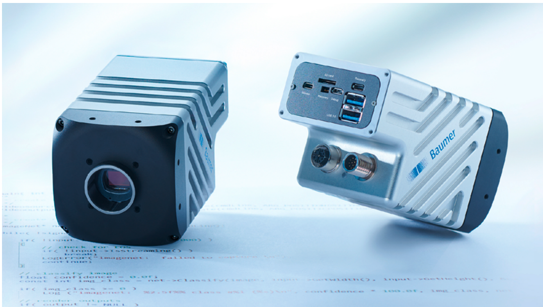
Image 1 : Les Smart Cameras AX réunissent robustesse industrielle, modules d'IA NVIDIA® Jetson™ leaders du marché et puissants capteurs CMOS Sony® avec une plateforme de traitement de l'image librement programmable.

qu'ils ont accès à des caméras compatibles GenICam de grande qualité et faciles à utiliser, à des PC industriels puissants pour le traitement des données d'image et à des outils de programmation d'application pratiques et flexibles, par exemple avec Python™ ou openCV. Baumer réunit tout ceci dans ses Smart Cameras AX adaptées à une utilisation industrielle. Elles simplifient l'accès au traitement de l'image industriel et facilitent des tâches telles que l'intégration de l'IA et le Deep Learning ainsi que l'intégration dans les environnements de l'industrie 4.0.